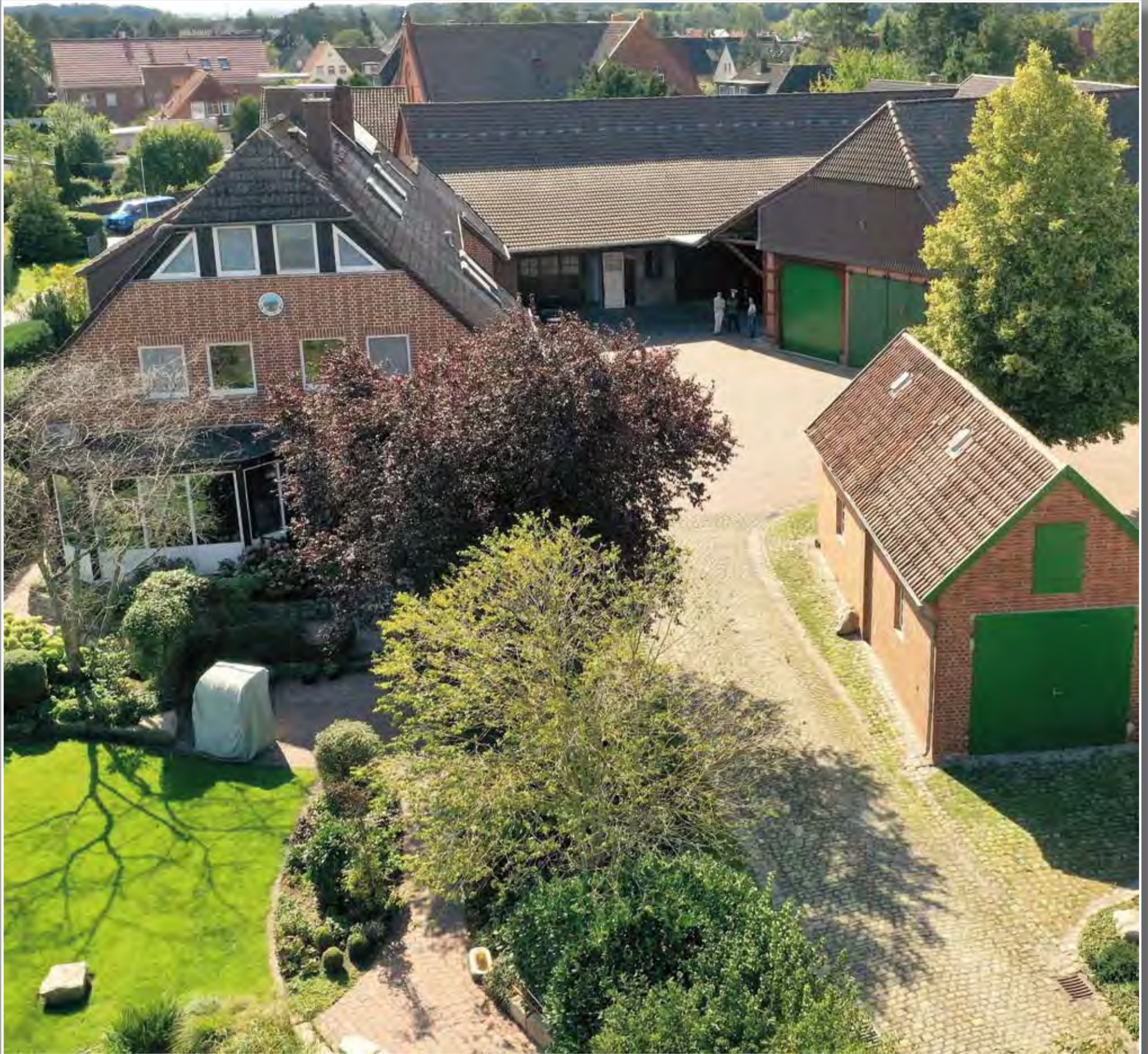
Die Hofstelle der Familie Ostermeyer wurde erstmals im Jahre 1535 erwähnt und befindet sich seit Anfang des 17. Jahrhunderts im Besitz der Familie. Der Hof entwickelte sich im Laufe des 20. Jahrhunderts zu einem modernen landwirtschaftlichen Betrieb und wird noch heute bewirtschaftet.