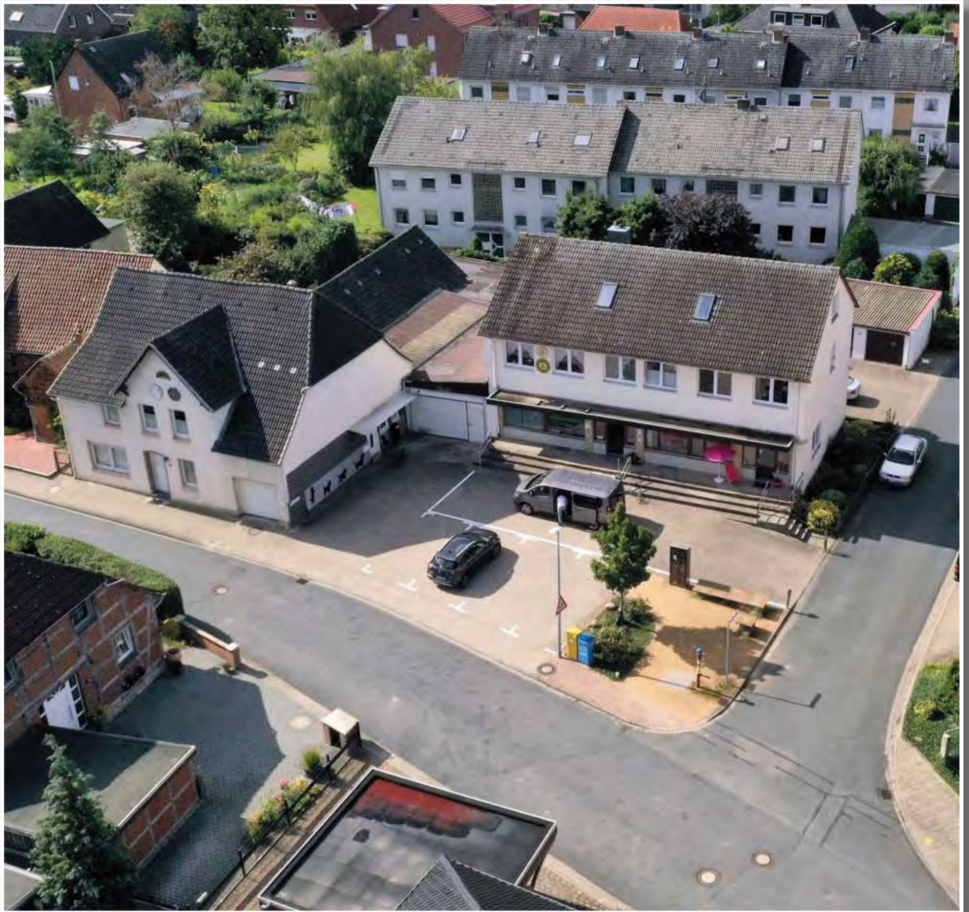
Brunnenstraße 8 – hier befand sich weit über 400 Jahre ein Kötnerhof. Das Grundstück wurde 1955 verkauft. Die alten Gebäude wurden im Jahr 1968 abgerissen. An deren Stelle entstanden in den 1970er Jahren ein Wohn- und Geschäftshaus sowie im hinteren Bereich mehrere Reihenhäuser.