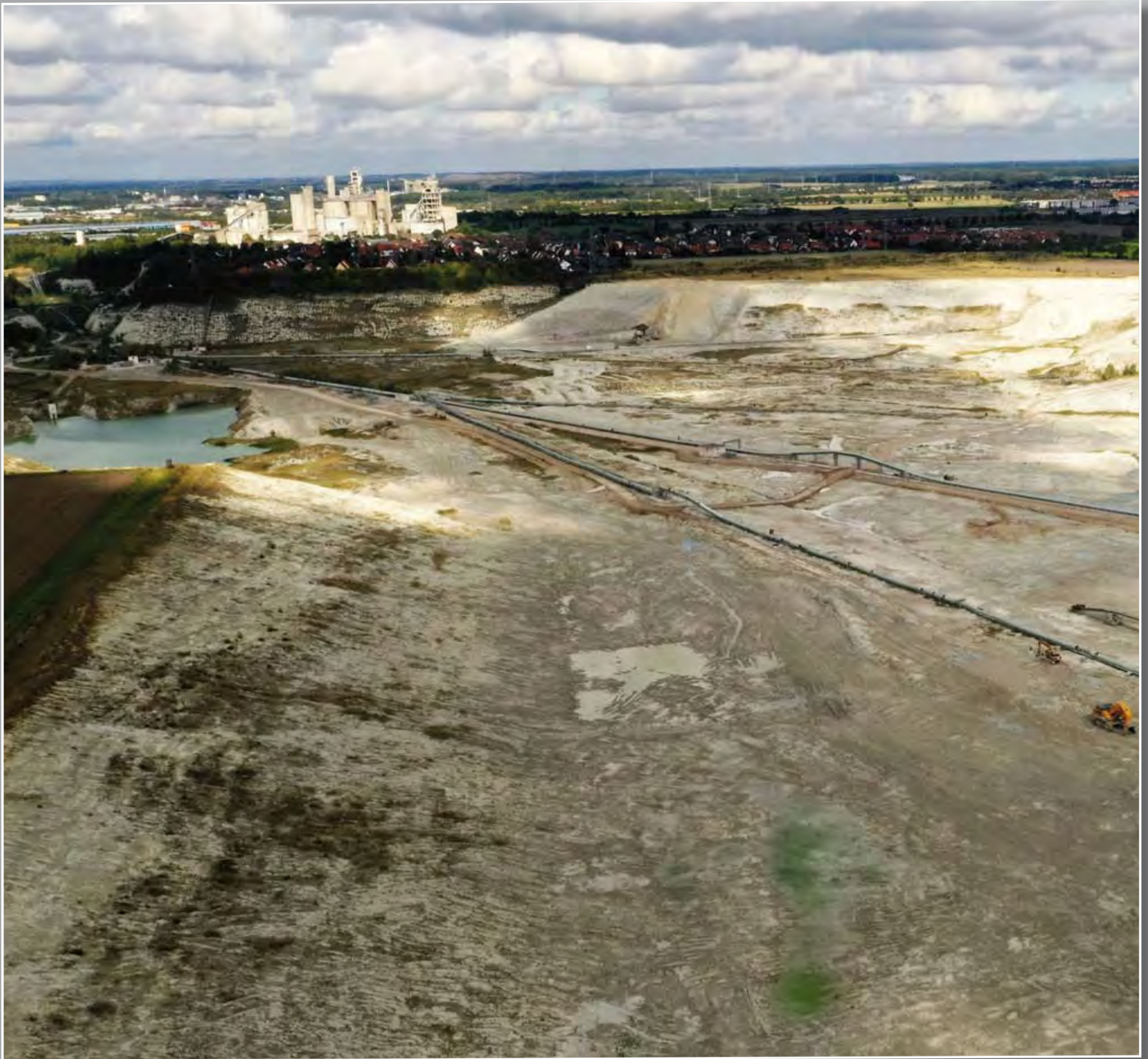
Das aktuelle Abbaugebiet des höverschen Zementwerkes erstreckt sich bis weit in die Bilmer Gemarkung hinein.