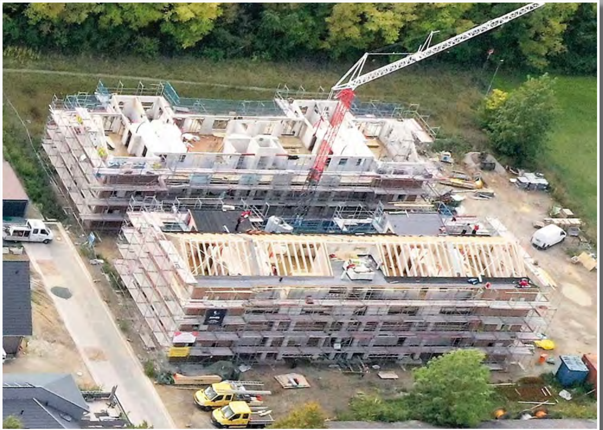
Fast fertig gestellt – das Neubaugebiet „Südweise“ in Höver längs der Straße „Am Kleikamp“. Die beiden Blöcke rechts bieten jeweils 12 Mietparteien Wohnraum.