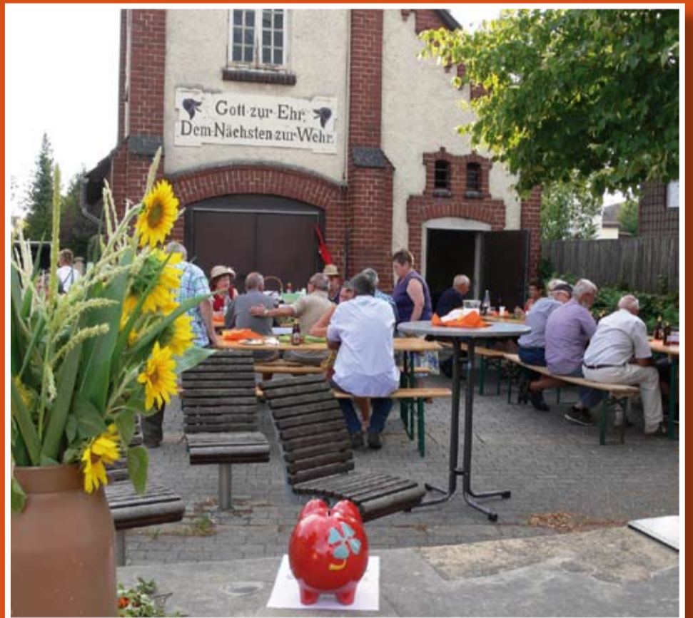
Gegrillt wurde seit dem Jahr 2009 auf dem „Bürgermeister-Köhler-Platz“ und 2018 vor dem alten Feuerwehrgerätehaus am Schulhof.