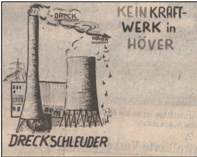
HAZ-Landkreiszeitung vom 26. August 1983, Plakat in Höver. Der Wille der Bevölkerung ist deutlich formuliert, steht unter diesem Foto.

und würde sich erst danach – positiv oder negativ – abschließend dazu äußern. Diese Haltung erzeugte in Höver bei den Bürgerinnen und Bürgern einen großen Unmut. Sie warfen der Stadt und auch den Stadtwerken vor, nicht ausreichend informiert zu werden. Sie brachten ihre Bedenken und ihre Kritik zunehmend und an vielen Stellen zum Ausdruck, öffentlich und hinter verschlossenen Türen.